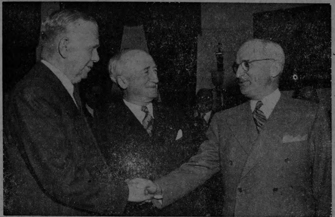
El Presidente de los Estados Unidos Mr. Truman congratula al nuevo Secretario de Estado General George C. Marshall, durante la ceremonia efectuada en la Casa Blanca, en Washington, al hacerse cargo este último de esas importantes funciones. Al centro de la fotografía, aparece el dimitente ex-Secretario de Estado Mr. James F. Byrnes.